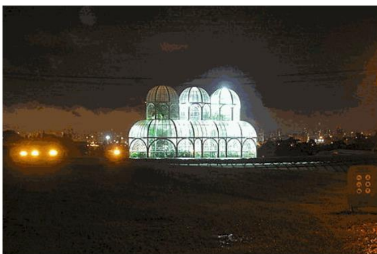
Hình 4: Khu Vườn Bách thảo của Curitiba ngày 27 tháng 3 ba 2010