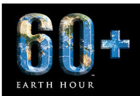
Hình 1: Biểu trưng của Giờ Trái Đất

Giờ Trái Đất (tiếng Anh: Earth Hour ) là một sự kiện quốc tế hằng năm, do Quỹ Quốc tế Bảo vệ Thiên nhiên ( World Wildlife Fund ) khuyến các hộ gia đình và cơ sở kinh doanh tắt đèn điện và các thiết bị điện không ảnh hưởng lớn đến sinh hoạt trong một giờ đồng hồ vào lúc 8h30 đến 9h30 tối (giờ địa phương) ngày thứ bảy cuối cùng của tháng ba hàng năm . Bắt đầu từ năm 2007 ở Sydney, số người tham gia chỉ có 2 triệu người. Nhờ các phương tiện truyền thông, số người năm 2008 là 50 triệu và năm 2009 là hơn 1 tỷ người, hơn 4000 thành phố. Năm 2010 có 126 nước tham gia. Năm 2011 là ngày 26 tháng 3 năm