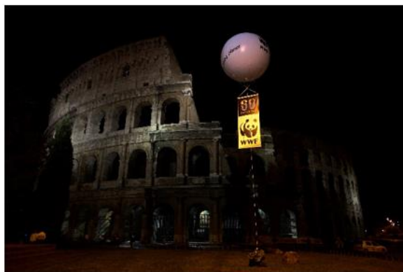
Hình 2: Đấu trường La Mã lúc 20h 29/3/2008

2011 và năm 2012 là 31 tháng 3 năm 2012.