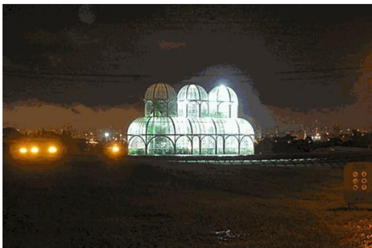
Hình 4: Khu Vườn Bách thảo của Curitiba ngày 27 tháng 3 năm 2010

Giờ Trái Đất 2010 dự kiến diễn ra lần lượt ở các quốc gia trên khắp thế giới vào ngày 27 tháng 03, 2010 theo giờ địa phương. Cho đến thời điểm hiện tại 92 quốc gia đã chính thức đăng ký tham gia, nhiều hơn năm trước 4 quốc gia. Các quốc gia lần đầu tiên tham gia: Ả Rập Xê Út, Brunei, Campuchia, Ecuador, Kosovo, Madagascar, Mauritius, Mông Cổ, Mozambique, Nepal, Oman, Panama, Paraguay, Qatar, Quần đảo Bắc Mariana, Quần đảo Faroe, Cộng hòa Séc, Tanzania. Đáng chú ý nhất là tất cả thành viên G20 đều tham gia; Áo tham gia với sự kiện tắt điện trên toàn lãnh thổ. Dân số ước tính gần 1 tỷ.