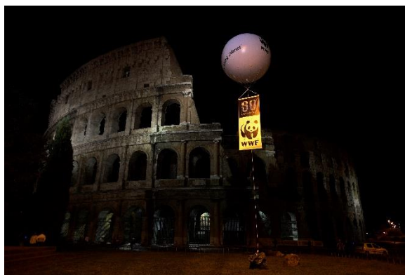
Hình 2: Đấu trường La Mã lúc 20h 29/3/2008

Trang web chính thức cho các sự kiện này, đã nhận được trên 6,7 triệu lượt truy cập chỉ trong đầu tuần hướng tới Giờ Trái Đất. Một số trang web khác cũng tham gia sự kiện này, đơn cử, trang chủ của Google khi ấy dùng nền trang màu đen với khẩu hiệu "Chúng tôi đã tắt đèn. Bây giờ đến lượt bạn. Giờ Trái Đất".