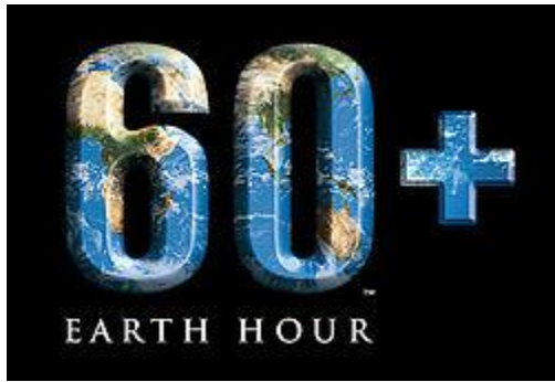
Hình 1: Biểu trưng của Giờ Trái Đất

Giờ Trái Đất (tiếng Anh: Earth Hour ) là một sự kiện quốc tế hằng năm, do Quỹ Quốc tế Bảo vệ Thiên nhiên ( World Wildlife Fund ) khuyến các hộ gia đình và cơ sở kinh doanh tắt đèn điện và các thiết bị điện không ảnh hưởng lớn đến sinh hoạt trong một giờ đồng hồ vào lúc 8h30 đến 9h30 tối (giờ địa phương) ngày thứ bảy cuối cùng của tháng ba hàng năm . Bắt đầu từ năm 2007 ở Sydney, số người tham gia chỉ có 2 triệu người. Nhờ các phương tiện truyền thông, số người năm 2008 là 50 triệu và năm 2009 là hơn 1 tỷ người, hơn 4000 thành phố. Năm 2010 có 126 nước tham gia. Năm 2011 là